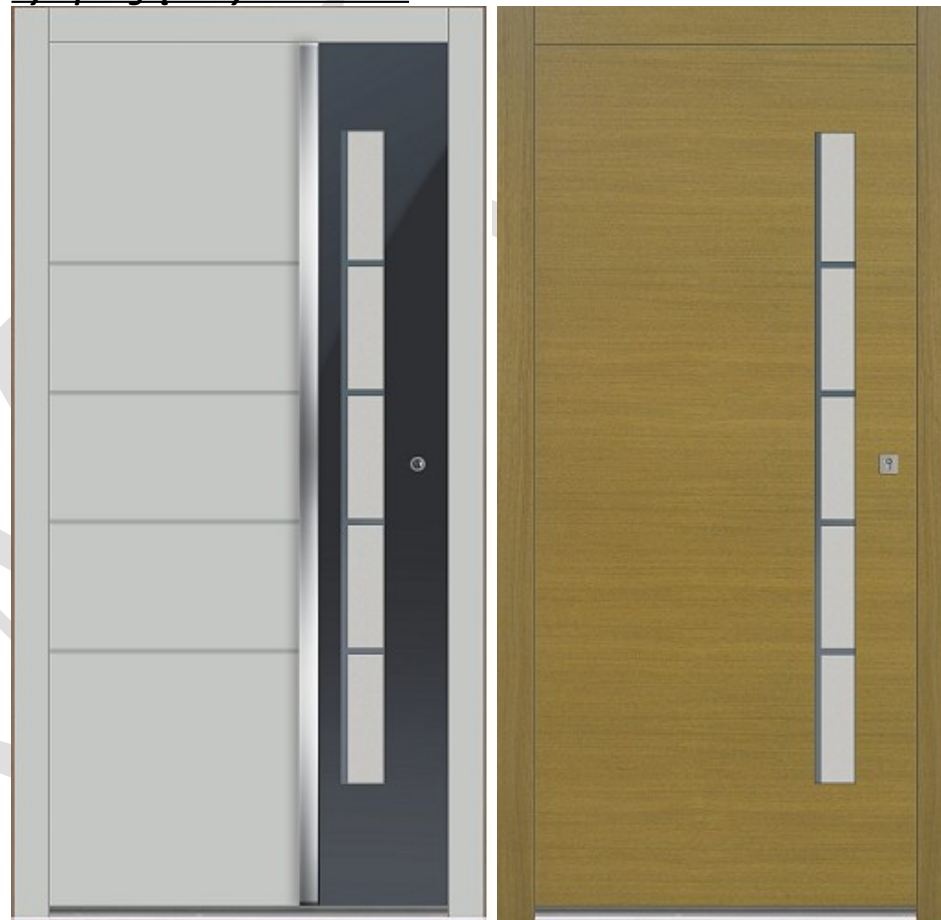
widok od zewnątrz