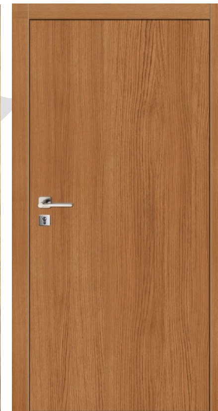
Widok od wewnątrz