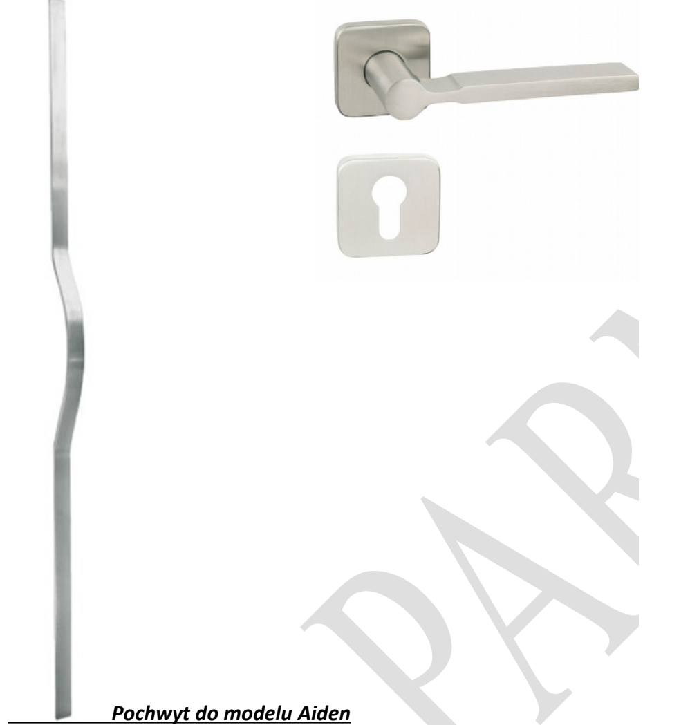
Pochwył do modelu Aiden